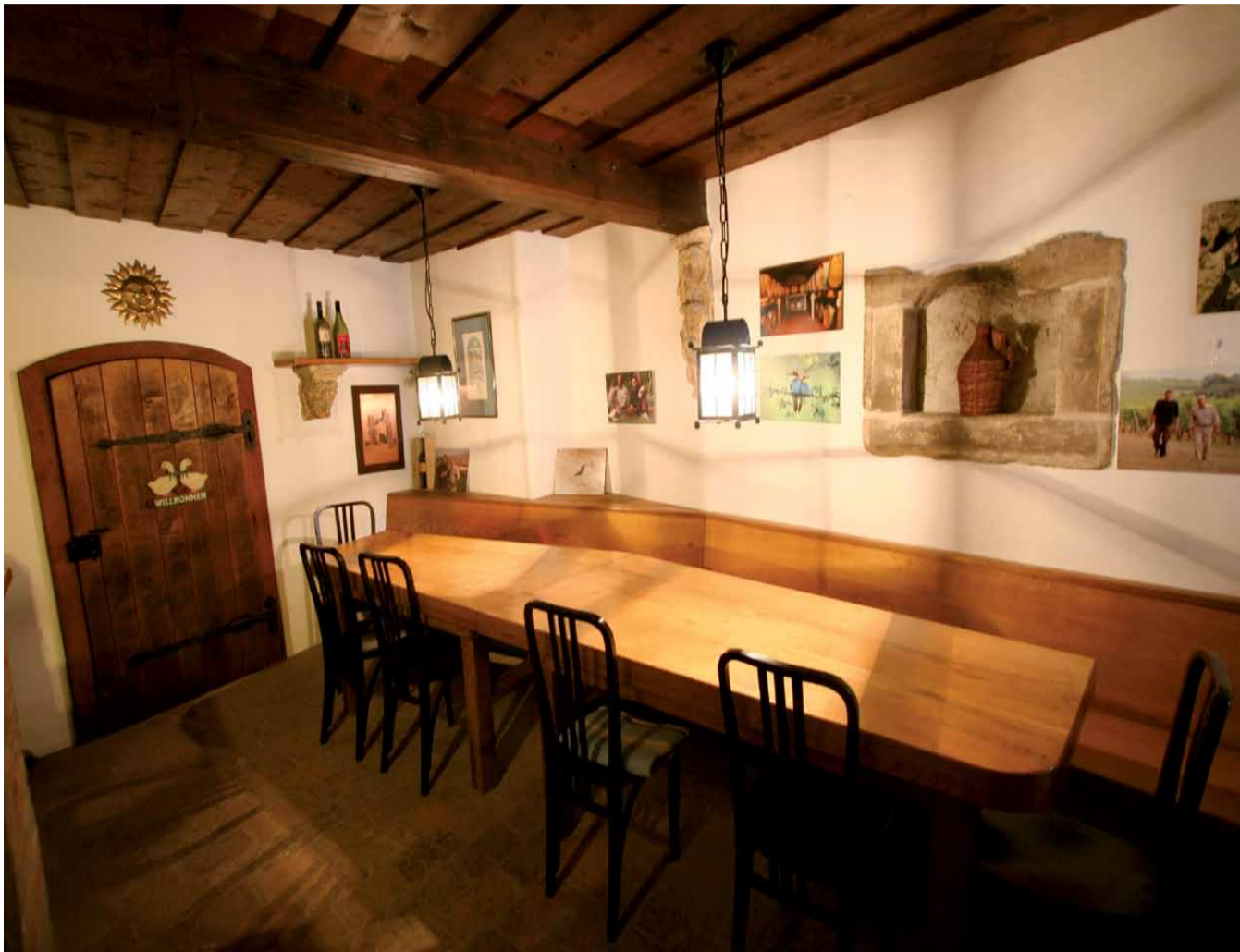
Obenaus-Keller: Weinsafes und Koststube

Die Großeltern nannten ihn den Obenaus-Keller, eine kleine, gemütliche Kellerstube am Ortsende von Göttlesbrunn. Mit dem alten Keller konnten wir lange Zeit nichts anfangen, da er zu klein geworden war, um in diesem Kellergewölbe ordnungsgemäß zu keltern.